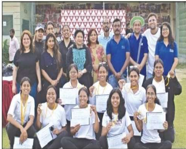
जूनियर बैच 2024-26 की दो टीमों टीम-1 और टीम-2 के बीच खेला गया। छात्र वर्ग का फाइनल मैच पहले मैच की विजेता टीम यानी पीजीडीएम जूनियर बैच 2024-26 की टीम-1

सीएसडी सहारा क्रिकेट एकेडमी, विपुल खण्ड, गोमती नगर, लखनऊ में वार्षिक क्रिकेट मैच 2024 का आयोजन किया गया। इस आयोजन में छात्र वर्ग का पहला मैच पीजीडीएम