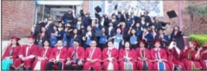
तेजस टुडे व्यू आरएल पाण्डेय

लखनऊ। आईओ एलओ एमओ एकेडमी ऑफ हायर लर्निंग गोमती नगर लखनऊ जो प्रबंधन शिक्षा के क्षेत्र में एक स्थापित नाम है, ने 17वां दीक्षांत समारोह ऐतिहासिक रूप से मनाया एवं पीओजीओएमओ और एमओबीओ के स्नातक स्तरों की डिप्लोमा और प्रमाण पत्र प्रदान किए गए। कॉविड महामारी के बाद यह पहला दीक्षांत समारोह है जो व्यक्तिगत रूप से सम्पन्न हुआ। इसमें वर्ष 2018-20, 2019-21 तथा 2020-22 के छात्रों को उपाधियाँ