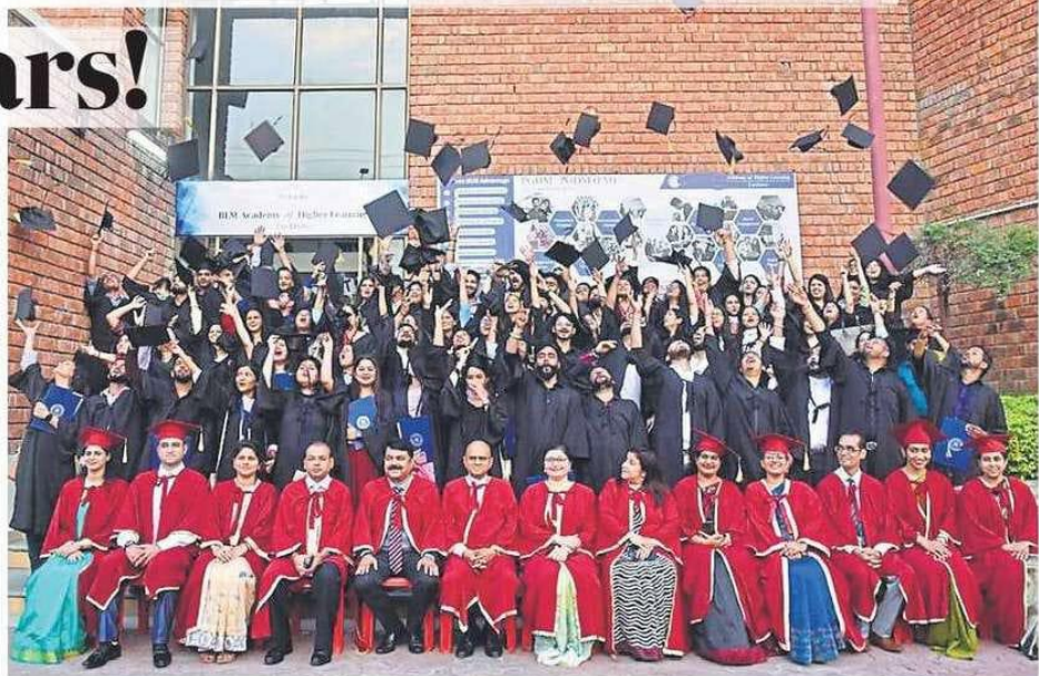
Institute's officials with the chief guest, guest of honour and students during the convocation. (Left) Students presenting Saraswati Vandana