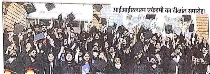
आईआईएलएम एकेडमी का दीक्षांत समारोह।